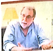
Jueza dictó medida.

Asimismo, consideró que en el caso de Luna Gálvez hay peligro procesal, por cuanto existe riesgo de fuga como de obstaculización". Al respecto, enfatizó que el exparlamentario "tiene la capacidad de obtener información de la investigación y que la única forma de neutralizarlo es que se dicte la prisión preventiva".