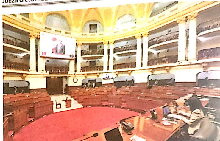
DISCUSIÓN Debate para nueva norma se extendió hasta la noche.