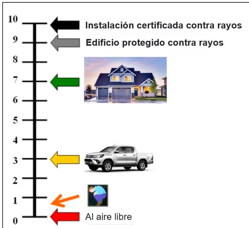
Ilustración comparativa de protección brindada por diferentes tipos de “refugios” estratégicos durante una tormenta eléctrica.

** Técnicamente un vehículo no debe ser un refugio seguro contra Rayos ya que no tienen puesta a tierra. Sin embargo, es algo a lo que uno tiene acceso, de no haber construcciones u otros, y es por esto que se consideran como refugios seguros contra Rayos en las actividades de campo.