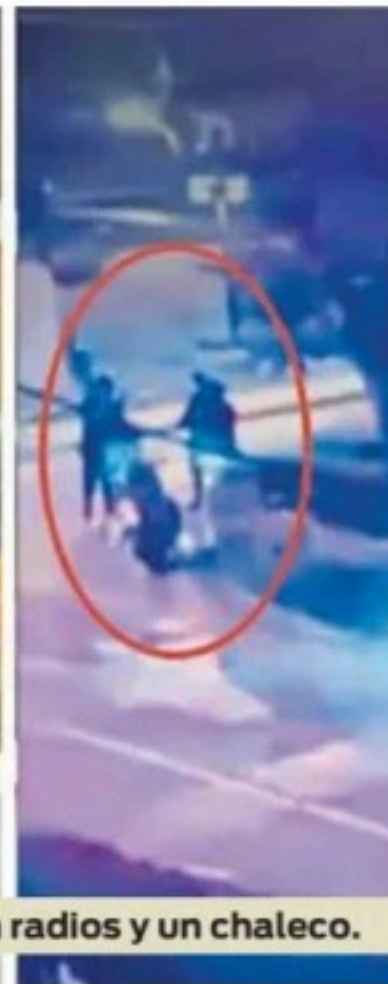
GOLPE. Sujetos robaron radios y un chaleco.